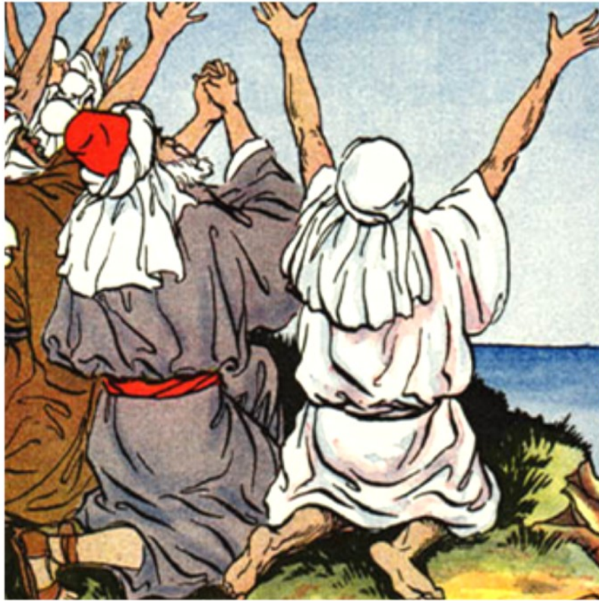
IMAGEN DEL DIOS INVISIBLE